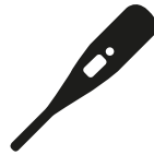
Verhoging of koorts