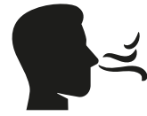
Reuk- en/of smaak- verlies

Heb je op dit moment een huisgenoot met koorts en/of benauwdheidsklachten?